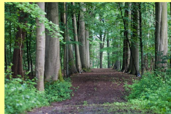
Dreef in het Heilig-Geestgoedbos

Bunkers: de vele bunkers die je hier in het landschap ziet maken deel uit van de bunkergordel: Bruggenhoofd Gent. Enkele bunkers zijn eigendom van Natuurpunt Boven-Schelde en werden vleermuisvriendelijk ingericht.