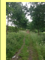
Eikenlaan in wording