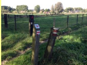
Grote Route pad wit/rood