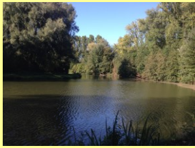
"den ouwen end"