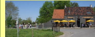
Eetcafé "De Rotse" vertrek en eindpunt