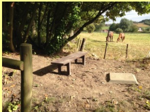
Bankje bij "Ziekeput"