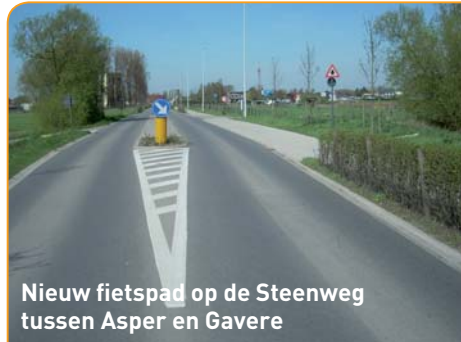
Nieuw fietspad op de Steenweg tussen Asper en Gavere

Er werden ook een aantal minder in het oog springende zaken gerealiseerd zoals een vistrap op de Moergracht ter hoogte van de monding in de Kriephoek (Semmerzake), de aanplant van essen langs de Donktstraat (Asper), het herstel van het netwerk van knotwilgen in de meersen te Semmerzake en de aanleg van een poel voor amfibien.